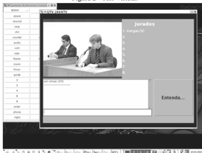
Figura 2 – Júri Virtual.

Na proposta, o juiz, o réu, os advogados e as testemunhas estão em um fórum participando do julgamento de um caso específico. Os jurados participam da sessão a partir de suas próprias casas, utilizando os recursos interativos da Televisão Digital. No protótipo criado, a votação é realizada por meio de controle remoto e os jurados têm acesso a todas as informações do júri através da Televisão e podem utilizar o chat como ferramenta para comunicação.